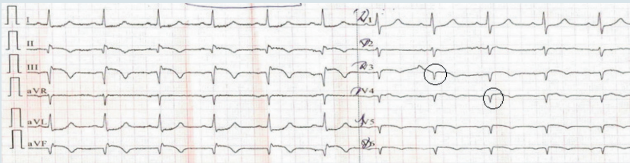
Рис. 2. ЕКГ пацієнта з правобічними грудними відведеннями (18 год від початку больового синдрому), в яких фіксуються ознаки трансмурального пошкодження ПШ

лом звичайна лівобічна ЕКГ – поганий індикатор пошкодження ПШ, оскільки ЛШ суттєво переважає ПШ за своїми електричними потенціалами і маскує зміни у ПШ на ЕКГ [2].