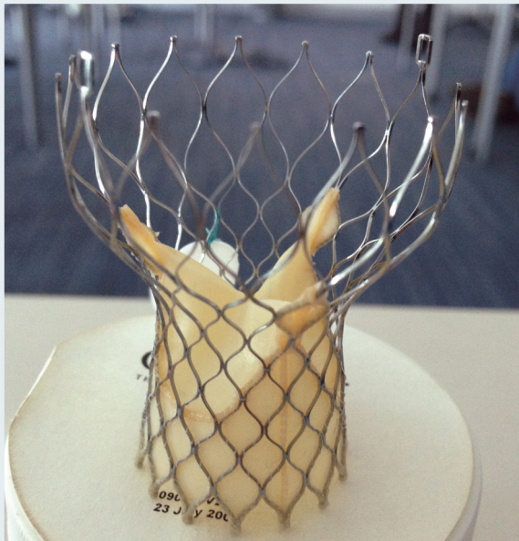
Рис. 1. Аортальний клапан CoreValve

Клінічний досвід транскатетерної імплантації АК підтверджено результатами понад 20 000 процедур з CoreValve, виконаних більш ніж у 40 країнах [6]. У 7 державних реєстрах повідомлено про частоту успіху втручання у 98 % випадках та про частоту інсультів менше 3 % [5]. Більше як у 80 % пацієнтів після імплантації функціональний клас серцевої недостатності за класифікацією NYHA поліпшився, як мінімум, на один. У 2007 р. система транскатетерної імплантації АК CoreValve отримала сертифікат відповідності європейським стандартам (CE-Mark) у лікуванні тяжкого АС. Дослідження ADVANCE системи CoreValve – наймасштабніше проспективне контрольоване багатоцентрове дослідження транскатетерної імплантації АК – показує, що лікування неоперабельних і ослаблених пацієнтів з високим ризиком за допомогою системи Medtronic CoreValve безпечно, пов'язане